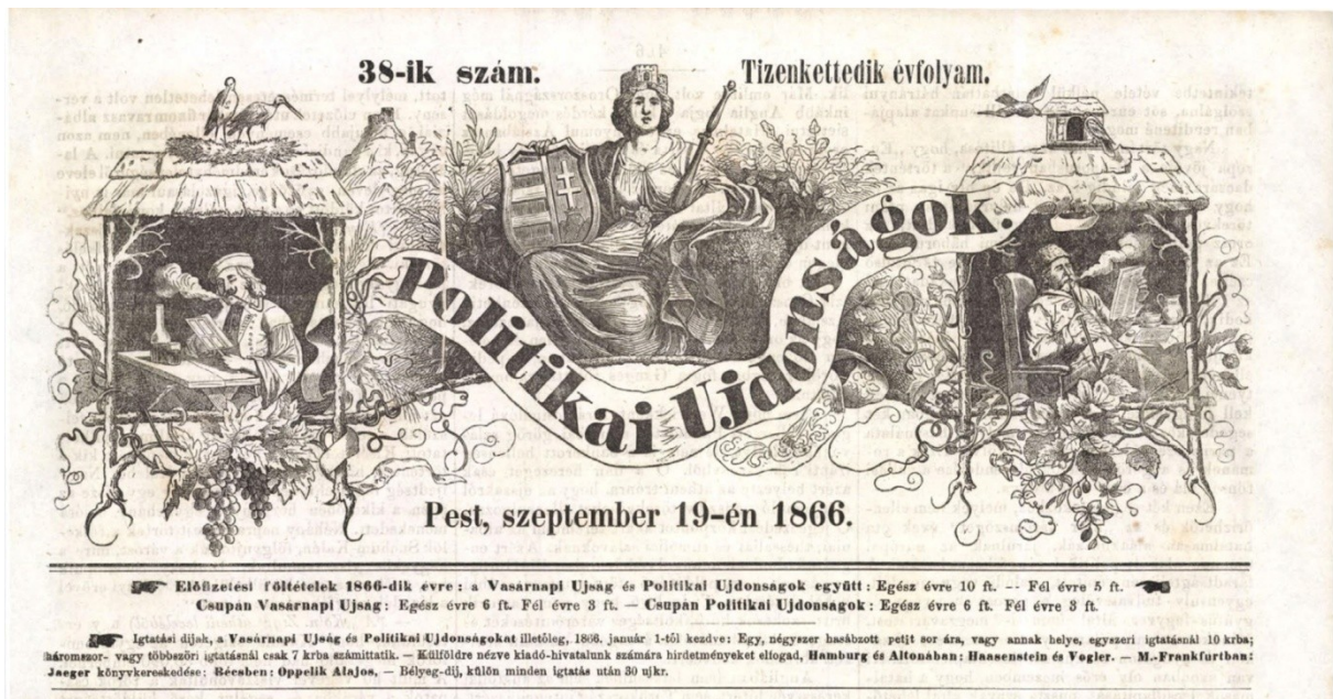
1. kép: Politikai Ujdonságok

Siófok (a Balaton partján), 1866. szeptember 12. ( Politikai Ujdonságok )